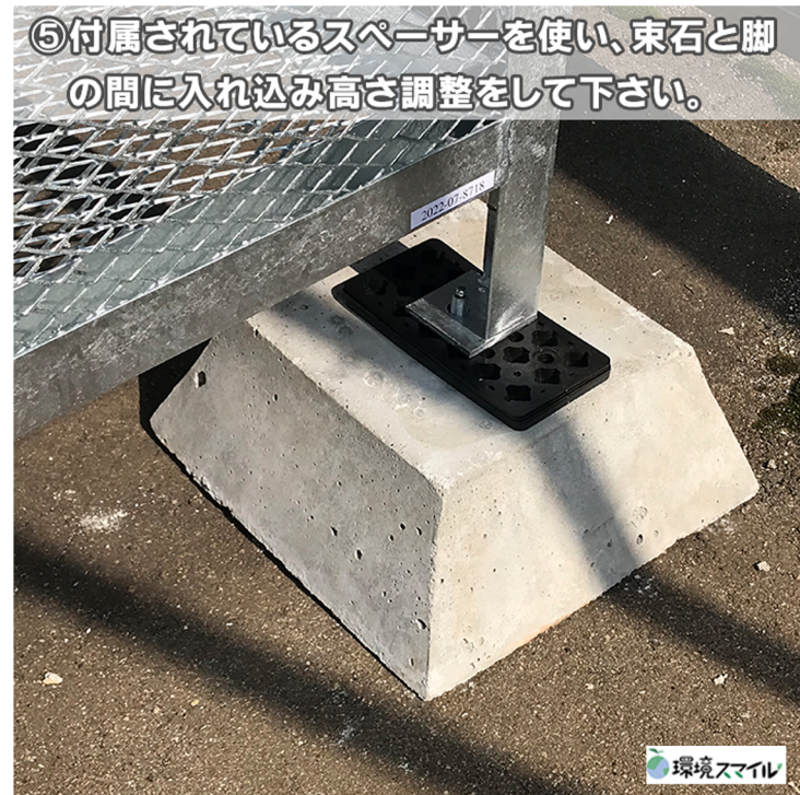
⑤付属されているスペーサーを使い、束石と脚の間に入れ込み高さ調整をして下さい。