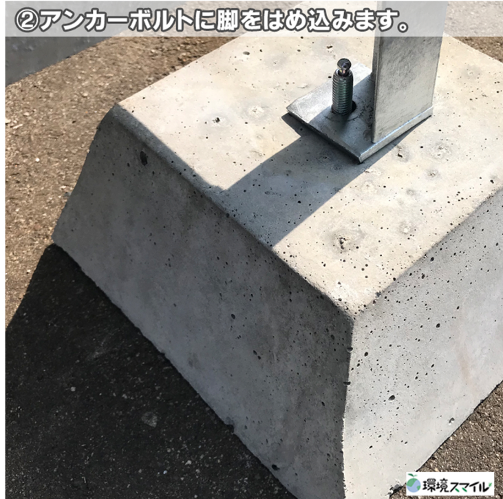
②アンカーボルトに脚をはめ込みます。