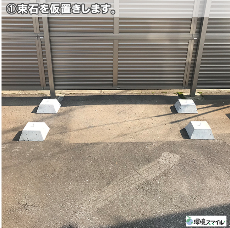
①束石を仮置きします。