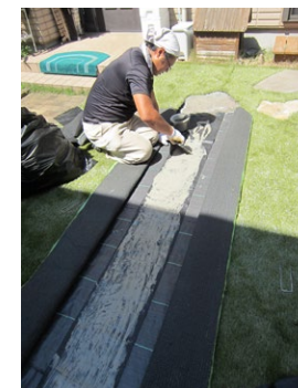
ジョイント部に接着剤を塗布する様子